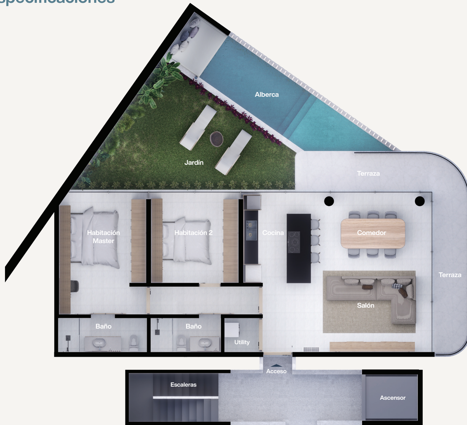
Nivel 1 Garden house