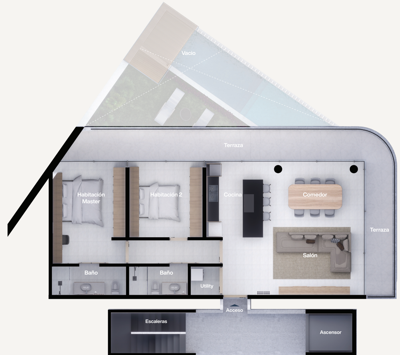
Nivel 2,3 y 4 Vivienda Tipo y Penthouse

Total: 179.96 m 2 Interior: 108,85 m 2 Terraza: 20.80 m 2 Jardín y Alberca: 51.16 m 2